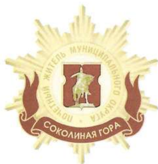
Рисунок нагрудного знака к званию «Почетный житель внутригородского муниципального образования – муниципального округа Соколиная гора в городе Москве»

Приложение 3 к решению Совета депутатов внутригородского муниципального образования - муниципального округа Соколиная гора в городе Москве от 18.02.2025 № 44/6